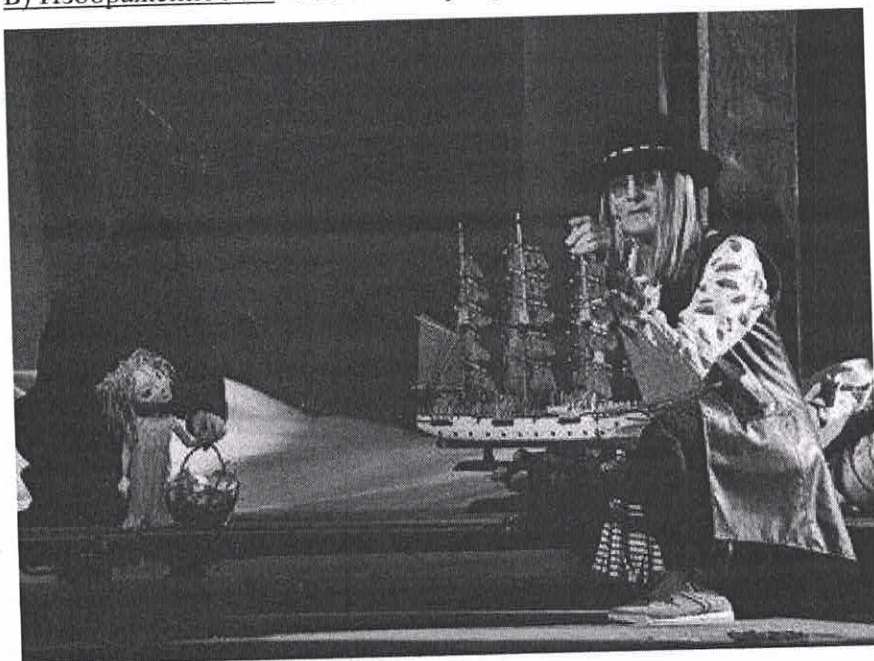
Б) Изображение №2. Омский государственный театр куклы, актёра, маски «Арлекин».