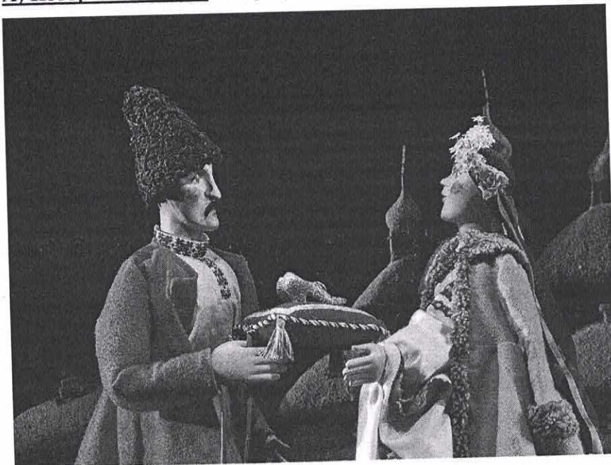
А) Изображение №1. Театр кукол С.В. Образцова.